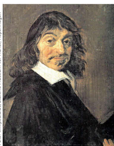
René Descartes im Jahr 1649.

Der Denker wurde vor 425 Jahren, am 31. März 1596, in der französischen Kleinstadt La Haye en Touraine geboren. Als Sohn einer kleinadeligen Familie genoss Descartes eine klassische Ausbildung und legte ein juristisches Examen ab. Als junger Mann kämpfte er unter anderem in den ersten Feldzügen des Dreißigjährigen Kriegs –